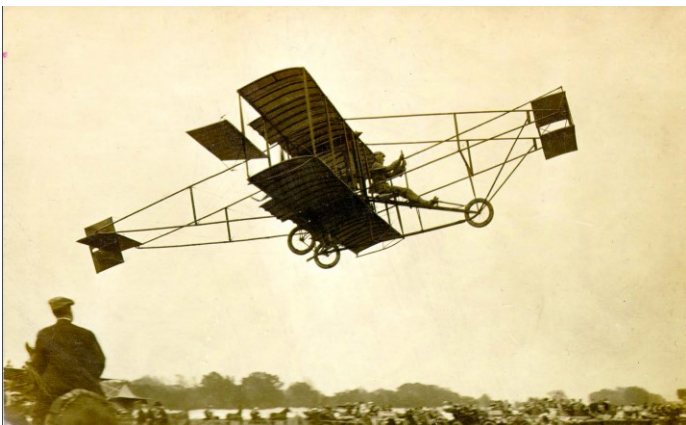
Eugen Ely pilots a Curtiss bi-plane during Wichita's first air show, 1911 at the Walnut Grove air meet, north of the city.

OWNER OPERATED COMPANY LICENSED GENERAL CONTRACTOR