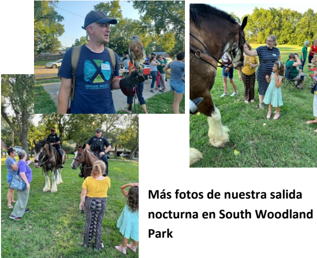
Más fotos de nuestra salida nocturna en South Woodland Park